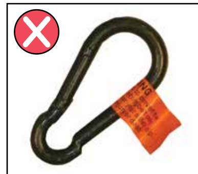
MOUSQUETON DE SÉCURITÉ