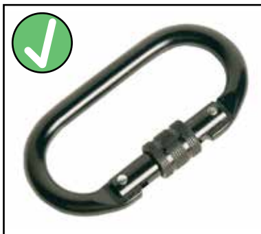
MOUSQUETON À VIS POUR HARNAIS

N'utilisez JAMAIS le mousqueton de sécurité à ressort pour sécuriser votre harnais au câble de sécurité.