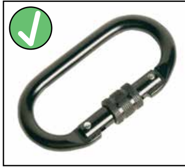
HARNESS TETHER SAFETY CLIP