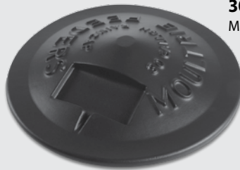
30-Gal/55-Gal Casquettes de pluie MFH-RC30 / MFH-RC55