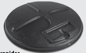
30-Gal/55-Gal Couvercles rapides MFH-QL30 / MFH-QL55